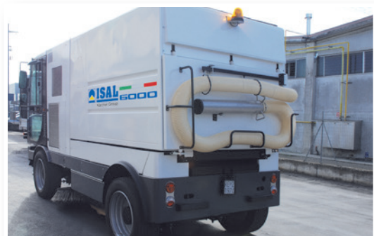
Tubo flessibile aspira detriti Flexible hose rubbles vacuum cleaner