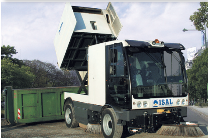
Scarico contenitore in quota Hopper high dump (high dump hopper)