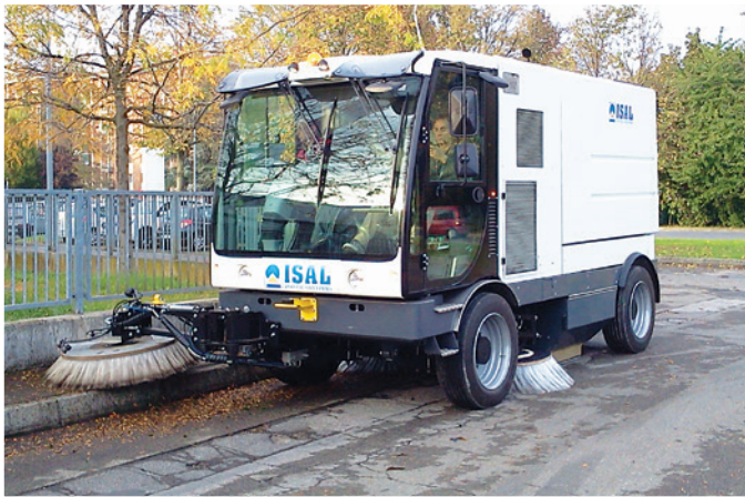
Terza spazzola con brandeggio destra e sinistra (180°) opt. Third broom working on left and right side (180°) opt.

Spazzatrice “meccanico-aspirante” per la pulizia urbana ed industriale “mechanical and suction” sweeper for urban and industrial cleaning