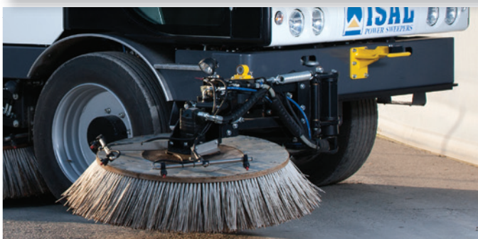
Larghezza di spazzamento da 1.320 mm a 3.600 mm Sweeping path from 1.320 mm to 3.600 mm